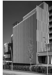
サントリー美術館

つきましては、貴媒体にてご紹介いただけますと幸いです。 ご一考のほどよろしくお願い申し上げます。