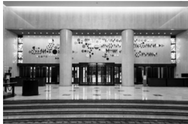
サントリーホール